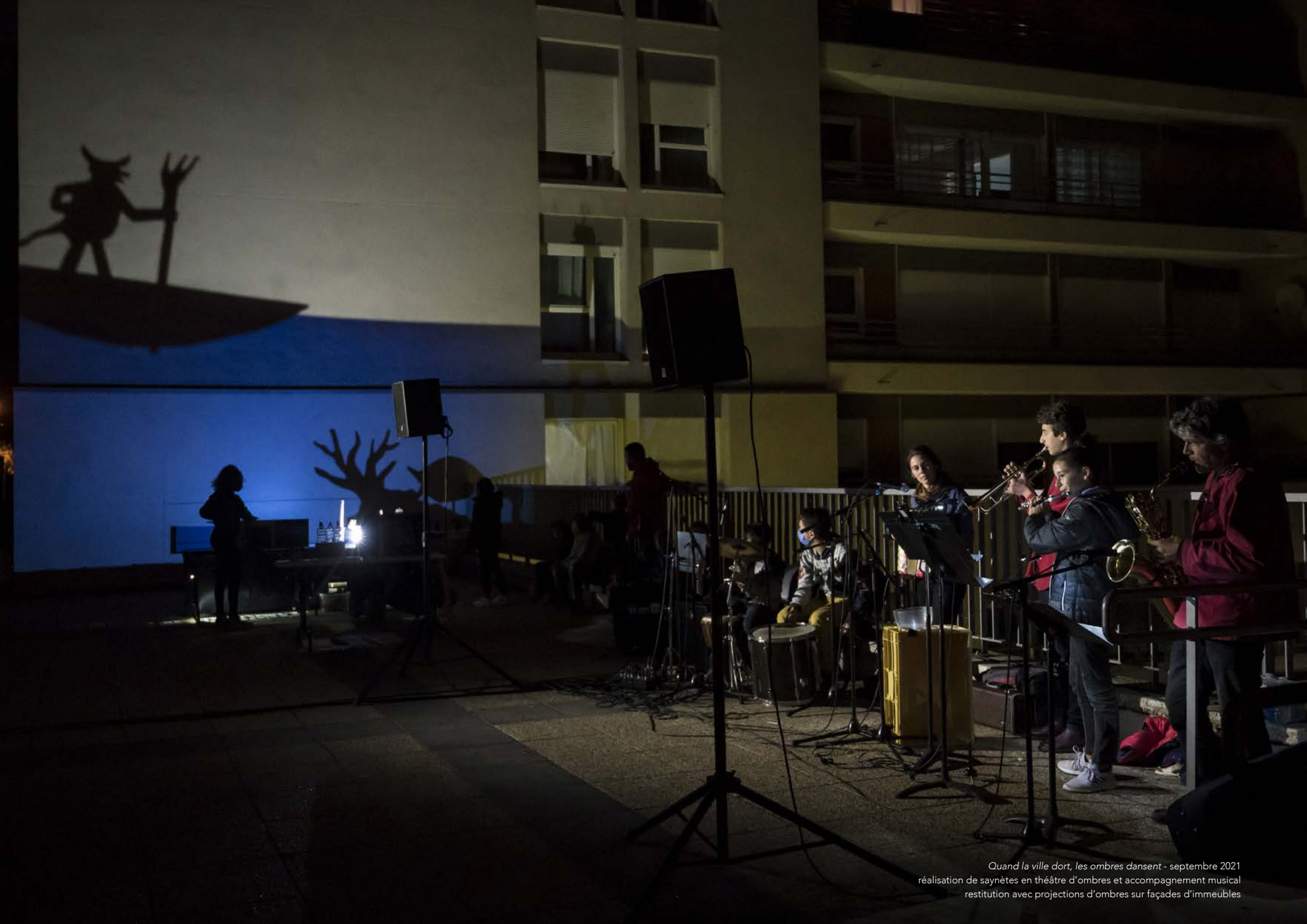
Quand la ville dort, les ombres dansent - septembre 2021 réalisation de saynètes en théâtre d'ombres et accompagnement musical restitution avec projections d'ombres sur façades d'immeubles