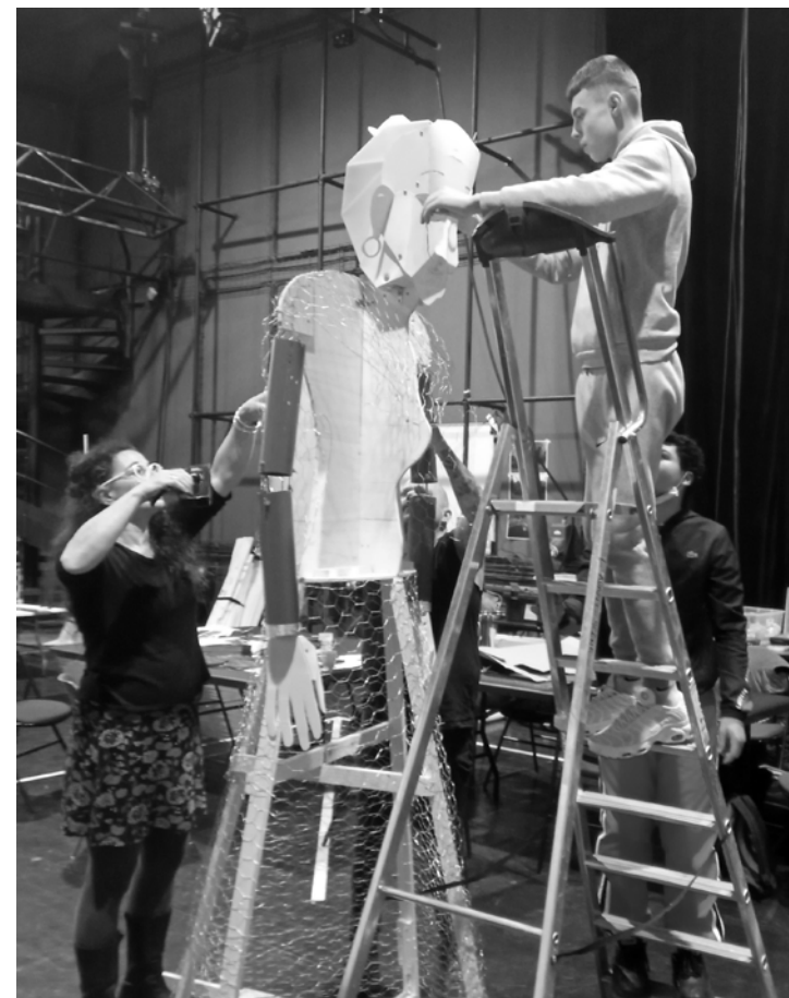
Ateliers divers : construction de décors, jeu d'acteurs et théâtre d'ombres

L'installation de l'espace d'atelier se fait avant l'atelier avec les intervenants de la compagnie et une personne du lieu d'accueil.