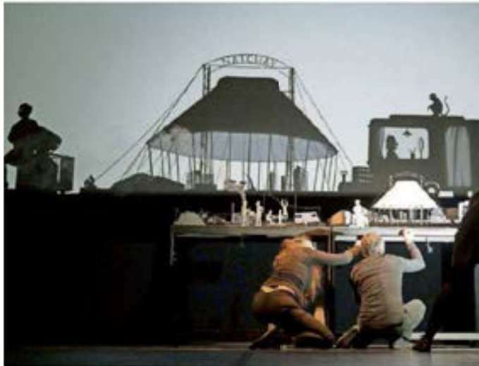
Echte Präzisionsarbeit: Mit Kreativität und Fingerspitzengefühl kreiert die Gruppe Les Ombres Portées in ihrem Stück „Natchav“ ein ganzes Universum.

Erst werden die Artisten an den Stadtrand verdrängt – im Schattenspiel sieht man sogar einen Schrottplatz –, dann wird gar einer von ihnen, der Mann mit dem Äffchen, eingesperrt. Nach einem Gerangel mit der Polizei. Da wird das Kindertheater ganz schön düster. So-