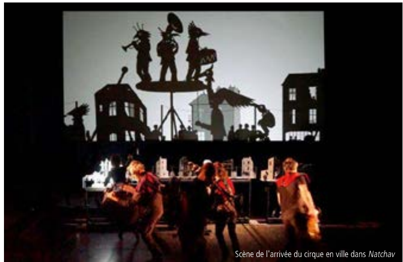
Scène de l'arrivée du cirque en ville dans Natchav

F.K. : Tu ne trouves pas que l'équilibre musical arrive quand un morceau se développe sur l'ensemble du spectacle, comme dans certaines musiques de film ? On en entend un fragment rythmique ici, une partie mélodique là, puis on reconnaît l'ensemble sur une scène clé. Par exemple, le thème de l'évasion, qui est