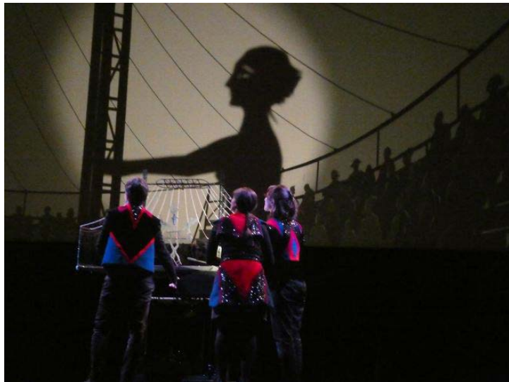
Les manipulations à vue, du grand art.

Un spectacle sur le thème de la liberté joué à La Maison