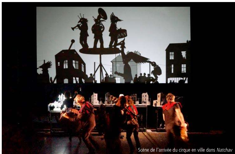
Scène de l'arrivée du cirque en ville dans Natchav

F.K. : Tu ne trouves pas que l'équilibre musical arrive quand un morceau se développe sur l'ensemble du spectacle, comme dans certaines musiques de film ? On en entend un fragment rythmique ici, une partie mélodique là, puis on reconnaît l'ensemble sur une scène clé. Par exemple, le thème de l'évasion, qui est