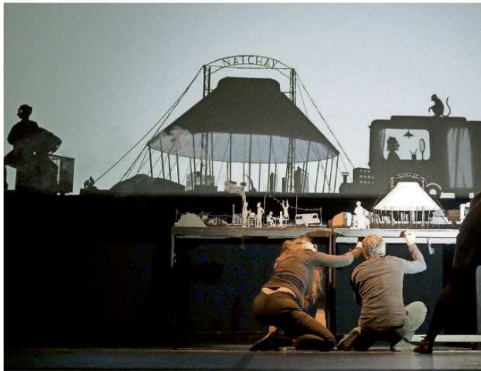
Echte Präzisionsarbeit: Mit Kreativität und Fingerspitzengefühl kreiert die Gruppe Les Ombres Portées in ihrem Stück „Natchav“ ein ganzes Universum.

Erst werden die Artisten an den Stadtrand verdrängt – im Schattenspiel sieht man sogar einen Schrottplatz –, dann wird gar einer von ihnen, der Mann mit dem Äffchen, eingesperrt. Nach einem Gerangel mit der Polizei. Da wird das Kindertheater ganz schön düster. So-