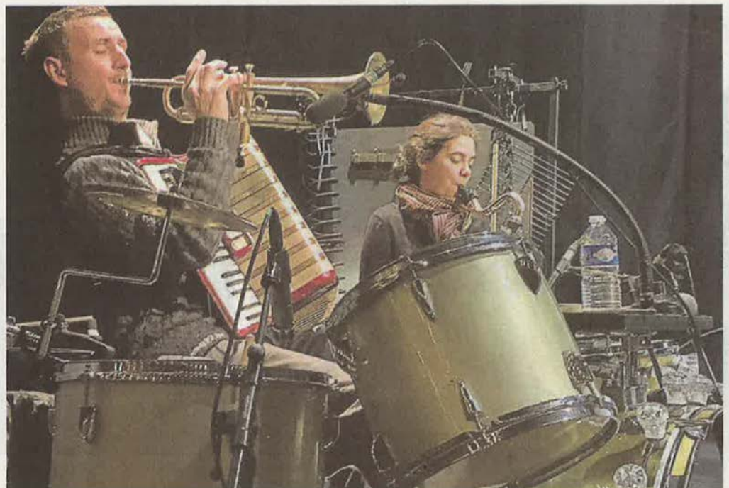
Répétition au Carré de la compagnie Les ombres portées, mercredi.

Natchav est le troisième spectacle de la compagnie qui travaille beaucoup autour des ombres et de la lumière, avec des musiciens. Pour cette création, la compagnie s'appuie aussi, sur un grand écran de 7 mètres sur 4 mètres.