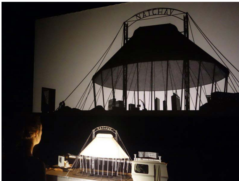
Dedans et dehors.