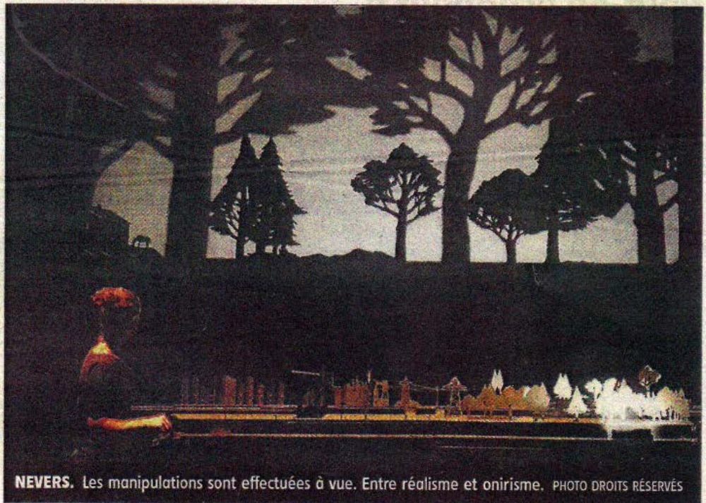
NEVERS. Les manipulations sont effectuées à vue. Entre réalisme et onirisme.