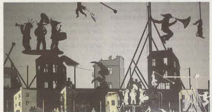
« Natchav » est un spectacle d'ombres portées.