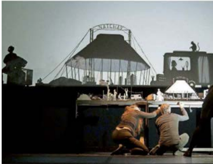
Echte Präzisionsarbeit: Mit Kreativität und Fingerspitzengefühl kreiert die Gruppe Les Ombres Portées in ihrem Stück „Natchav“ ein ganzes Universum.

Erst werden die Artisten an den Stadtrand verdrängt – im Schattenspiel sieht man sogar einen Schrottplatz –, dann wird gar einer von ihnen, der Mann mit dem Äffchen, eingesperrt. Nach einem Gerangel mit der Polizei. Da wird das Kindertheater ganz schön düster. So-