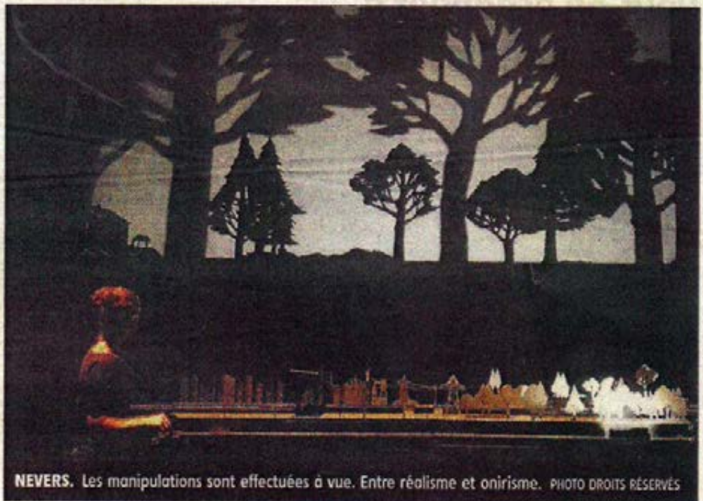
NEVERS. Les manipulations sont effectuées à vue. Entre réalisme et onirisme.