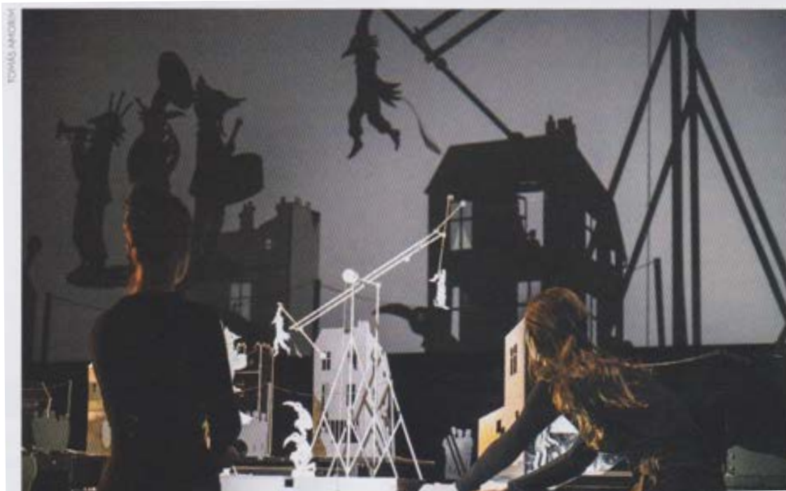
Natchav, compagnie Les Ombres portées (2019).