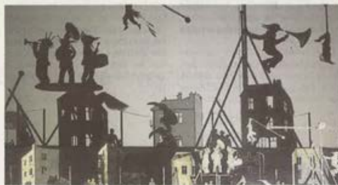
« Natchav » est un spectacle d'ombres portées.