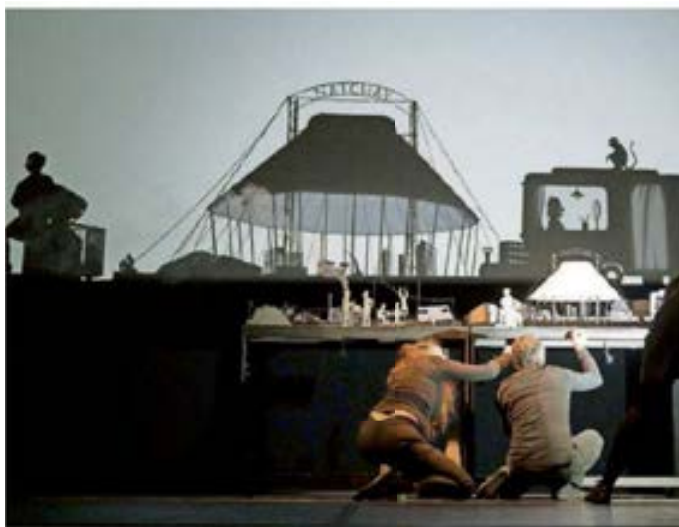
Echte Präzisionsarbeit: Mit Kreativität und Fingerspitzengefühl kreiert die Gruppe Les Ombres Portées in ihrem Stück „Natchav“ ein ganzes Universum.

Erst werden die Artisten an den Stadtrand verdrängt – im Schattenspiel sieht man sogar einen Schrottplatz –, dann wird gar einer von ihnen, der Mann mit dem Äffchen, eingesperrt. Nach einem Gerangel mit der Polizei. Da wird das Kindertheater ganz schön düster. So-