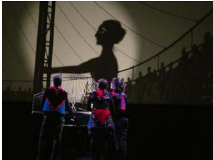
Les manipulations à vue, du grand art.

Un spectacle sur le thème de la liberté joué à La Maison