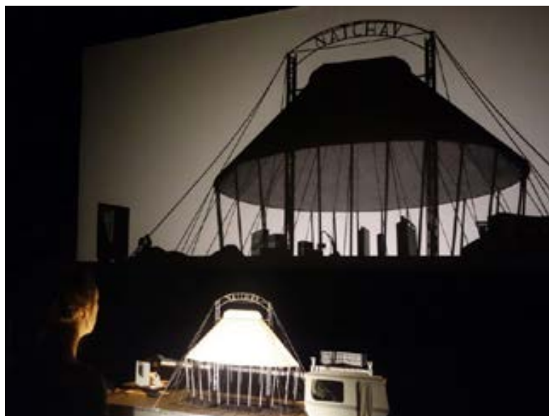
Dedans et dehors.