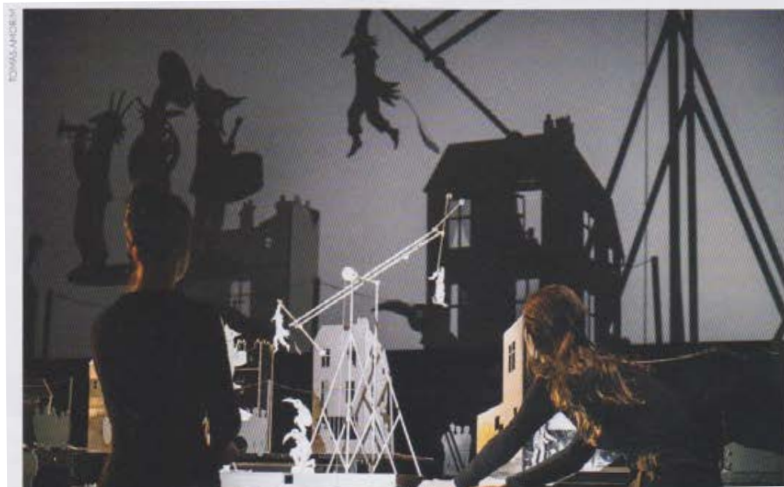
Natchav, compagnie Les Ombres portées (2019).