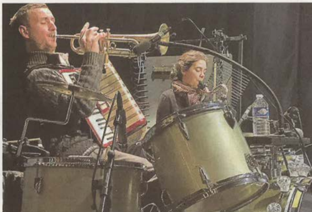
Répétition au Carré de la compagnie Les ombres portées, mercredi.

Natchav est le troisième spectacle de la compagnie qui travaille beaucoup autour des ombres et de la lumière, avec des musiciens. Pour cette création, la compagnie s'appuie aussi, sur un grand écran de 7 mètres sur 4 mètres.