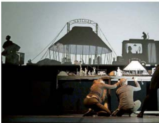
Echte Präzisionsarbeit: Mit Kreativität und Fingerspitzengefühl kreiert die Gruppe Les Ombres Portées in ihrem Stück „Natchav“ ein ganzes Universum.

Erst werden die Artisten an den Stadtrand verdrängt – im Schattenspiel sieht man sogar einen Schrottplatz –, dann wird gar einer von ihnen, der Mann mit dem Äffchen, eingesperrt. Nach einem Gerangel mit der Polizei. Da wird das Kindertheater ganz schön düster. So-