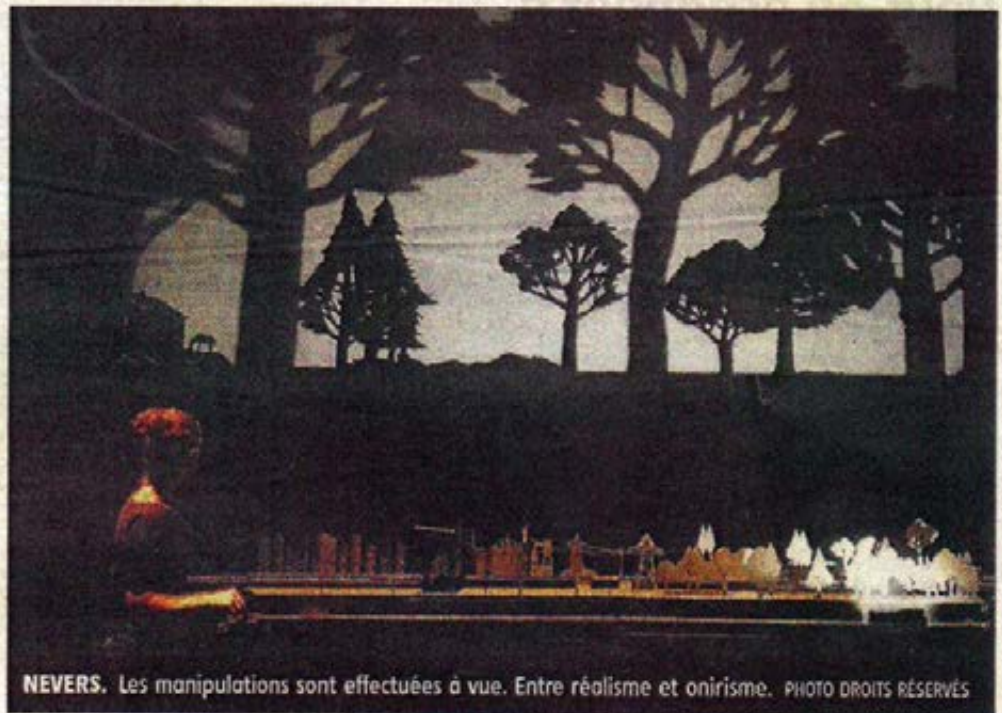
NEVERS. Les manipulations sont effectuées à vue. Entre réalisme et onirisme.