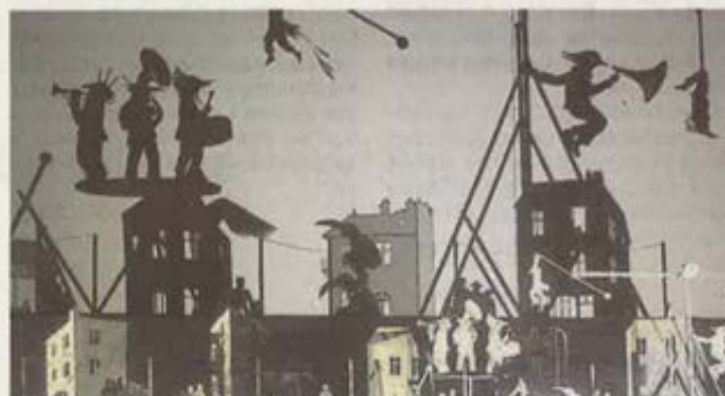
« Natchav » est un spectacle d'ombres portées.