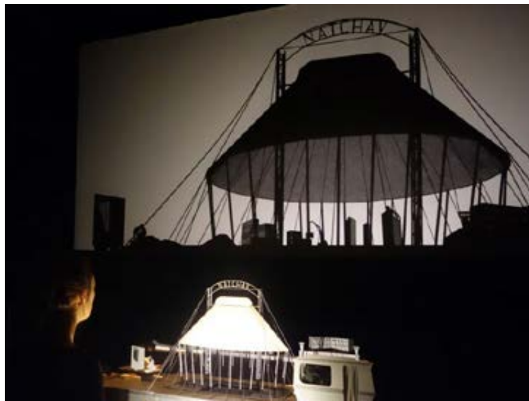
Dedans et dehors.