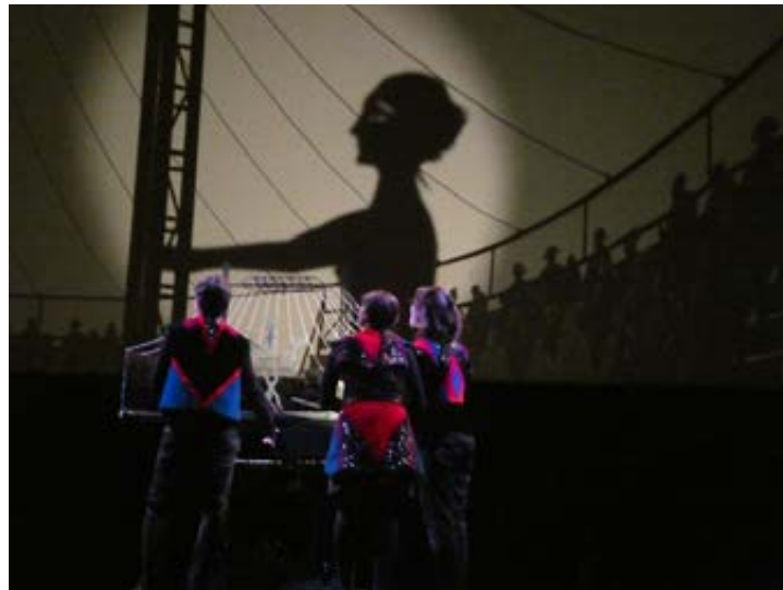
Les manipulations à vue, du grand art.

Un spectacle sur le thème de la liberté joué à La Maison