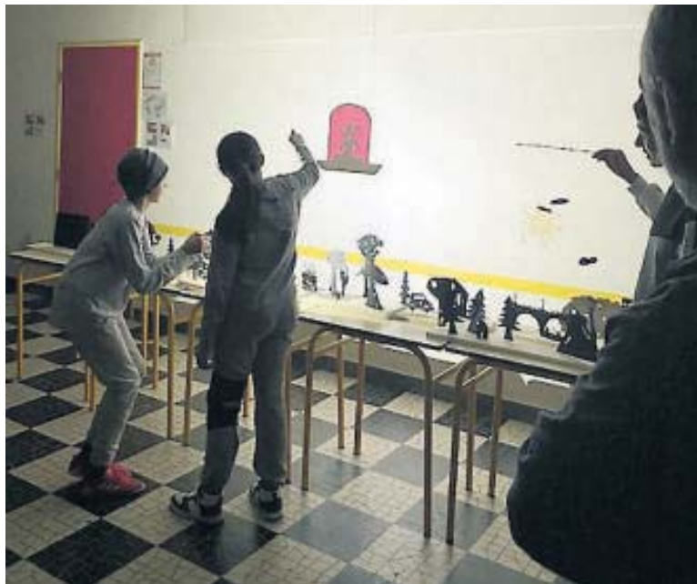
Une belle initiative pour les élèves.

L'Espace d'Albret a terminé son année en beauté. Il y a quelques jours de cela, les élèves de la classe UPE2A de la Cité scolaire de Nérac ont suivi un atelier d'initiation aux premières techniques du théâtre d'ombres avec la compagnie Les Ombres Portées. Au programme : dessin et découpage de silhouettes et de décors pour expérimenter les notions de formes et contre-formes. Ce joli travail a été exposé dans le hall de l'Espace d'Albret les jours des représentations de la Compagnie. Les élèves ont également assisté à un spectacle. Par ailleurs, la Compagnie SenCirk'a été ac-